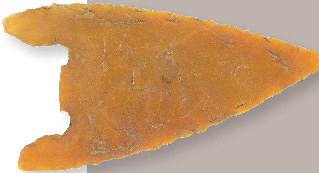
Spits (vuursteen) 2500-2000 v.Chr. vindplaats Westlaan, Velsbroek.