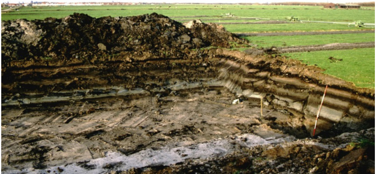
“Engelse drop”; Oer-IJ-oeverlagen ontsloten, Westbroekplas.

Het gestapelde landschap vormt een bijzondere karakteristiek van de Velsense bodem. Vanaf de Steentijden tot in de Late Middeleeuwen bouwde de bodem zich laag na laag op, waarbij de in cultuur gebrachte niveaus van elkaar gescheiden bleven door beschermende stuifzanden en kleiafzettingen. Vanzelfsprekend komen deze landschappen in Velsbroek en in het gebied van de Jonge Duinen voor. Maar ook elders in de gemeente is hun aanwezigheid aangetoond, van Santpoort-Zuid tot Velsen-Noord.