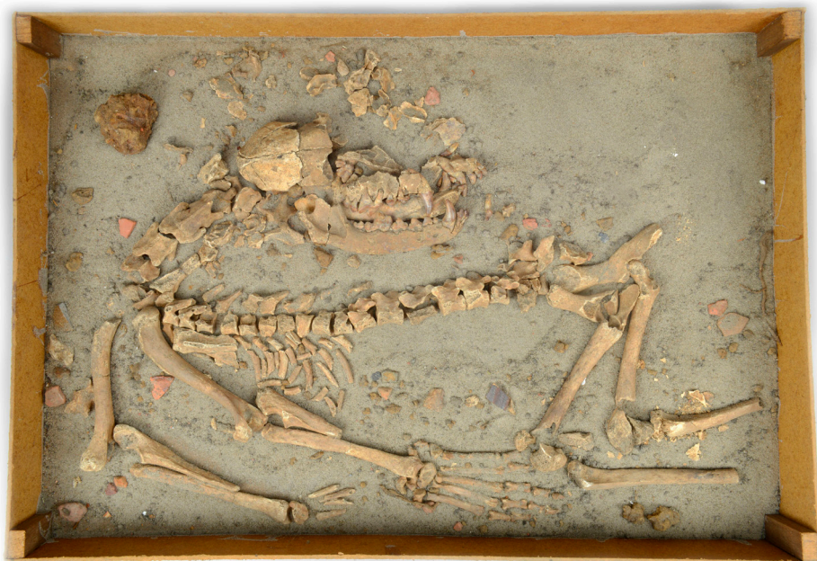
Hondenskelet, graf in situ geborgen, 1500-1700 n.Chr., vindplaats rugbyveld Hofgeesterweg, Velsbroek.

Resten in de bodem die getuigen van jagers en verzamelaars, prehistorische boeren en Romeinen. Maar ook de 'geest'-structuren, dijken en resten van tuinaanleg, de ruïne van Brederode, de oude kerk van Velsen en buitenplaatsen als Beeckestijn en Duin en Kruidberg. En niet te vergeten de sporen van recente geschiedenis zoals industrieën, fabrieken en de Tweede Wereldoorlog.