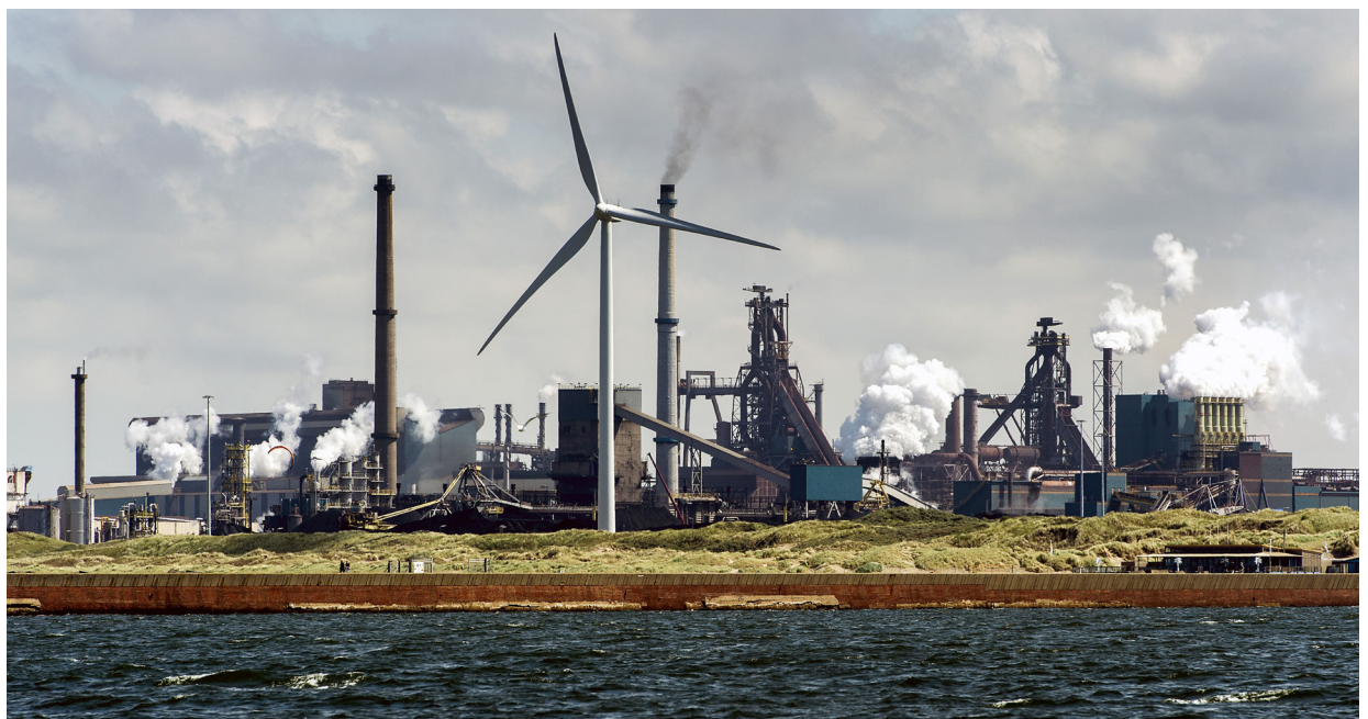
Gezicht op Tata Steel.

De aanleg van het Noordzeekanaal en de zeesluizen in de tweede helft van de 19de eeuw en het begin van de 20ste eeuw veroorzaakte niet alleen een ruimtelijk, maar ook een psychologisch (schok)effect. De voor de aanleg noodzakelijke structuren en elementen kunnen ook tot het industriële landschap worden gerekend, zelfs wanneer het als ongewenst of tijdelijk werd gezien, zoals het kanaalgraversdorp 'de Heide'. Deze elementen, maar ook de vanwege het kanaal tot ontwikkeling gekomen industrieën, hebben tot nu toe slechts beperkte archeologische aandacht gekregen, maar winnen de laatste tijd terecht in toenemende mate aan belangstelling.