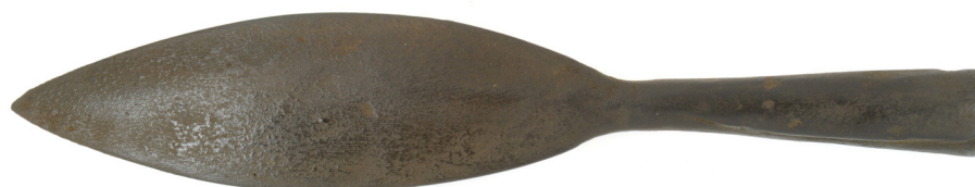
Lanspunt/speerpunt, 400-200 v.Chr. vindplaats Broekerwerf, B6, Velsbroek.

Alhoewel veel van deze pracht nog deel uitmaakt van het huidige landschap zijn de meeste sporen uitsluitend in de bodem bewaard gebleven. De vrijetijdsarcheologen van de AWN hebben belangrijke onderzoeksresultaten behaald bij zowel Beekestijn als Waterland. Een voor archeologen bijzondere buitenplaats was Papenburg, nabij de Hagelingerweg, in het gebied Groeneveen. De bewoner hiervan had in de eerste helft van de 18de eeuw onder meer een grote collectie Griekse en Romeinse oudheden verzameld. Na zijn overlijden is dit deel van de collectie overgebracht naar Leiden waar ze de basis vormde voor het Rijksmuseum voor Oudheden en nog steeds te bewonderen is.