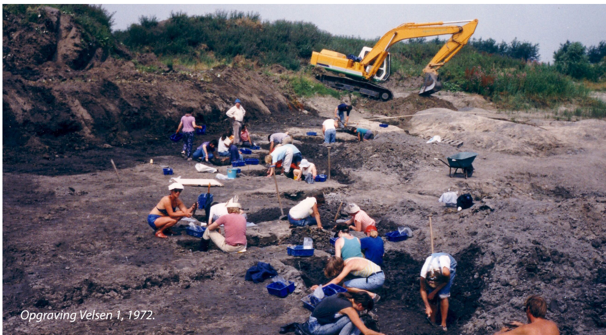
Opraving Velsen 1, 1972.

In de volgende pagina's zal worden toegelicht hoe de gemeente deze doelen vormgeeft, uitwerkt en uitvoert.