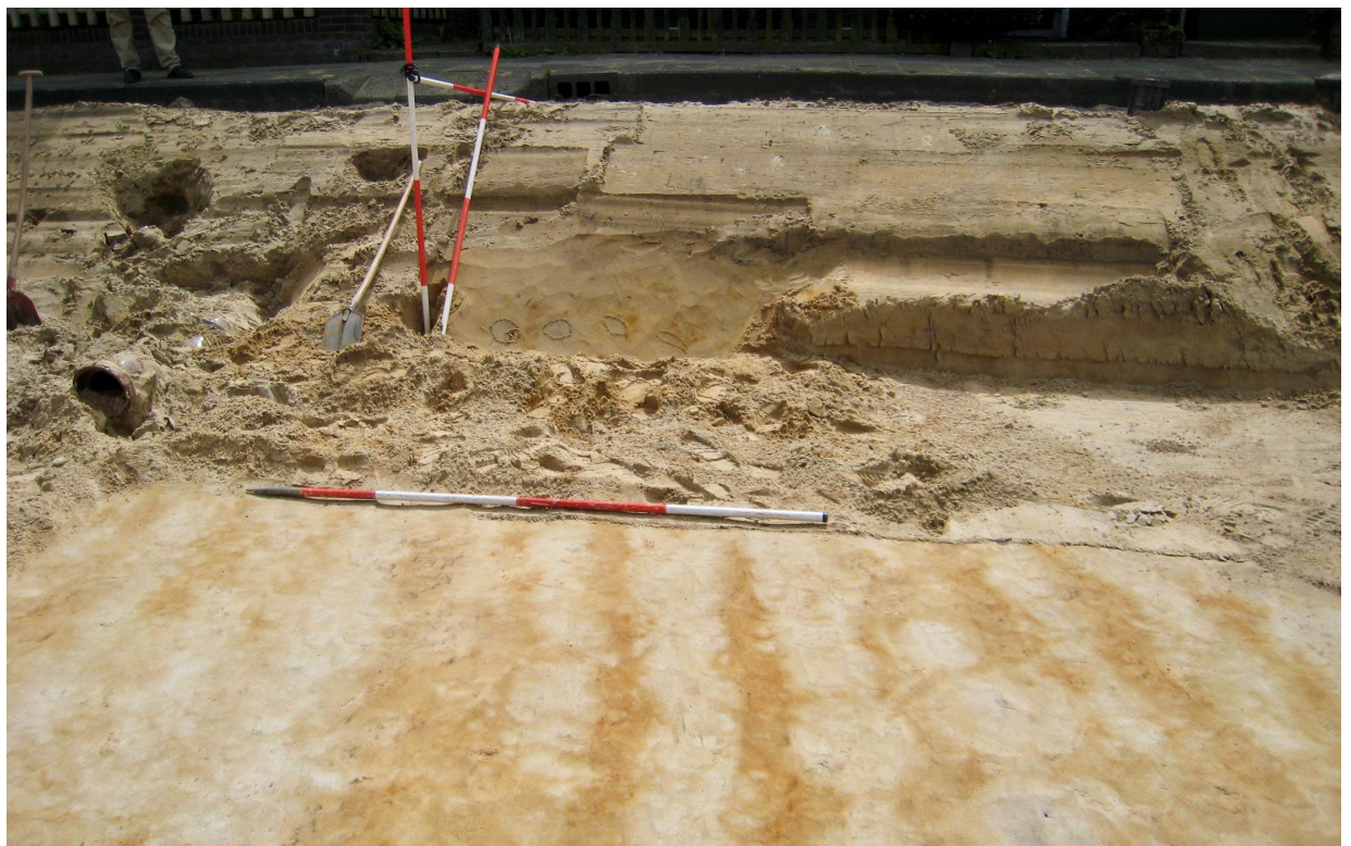
Ploegsporen, IJmuidersstraatweg, 2014.

Aan de bekende en te verwachten archeologische resten is een waarde toegekend. Op basis van deze archeologische waarde zijn categorieën vastgesteld met elk hun eigen regime. Zo is voor de gebieden met een zeer hoge archeologische verwachting een strenger regime bepaald en hebben de gebieden met een lage archeologische verwachting een ruimer regime gekregen.