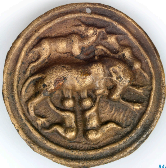
Medaillon Romulus en Remus 40-50 n.Chr., vindplaats Velsen II.

Op deze manier beschermen, benutten en beleven we het verleden en het verhaal van Velsen. Daardoor hebben we meer inzicht in het hier en nu en een stevige basis voor de toekomst!