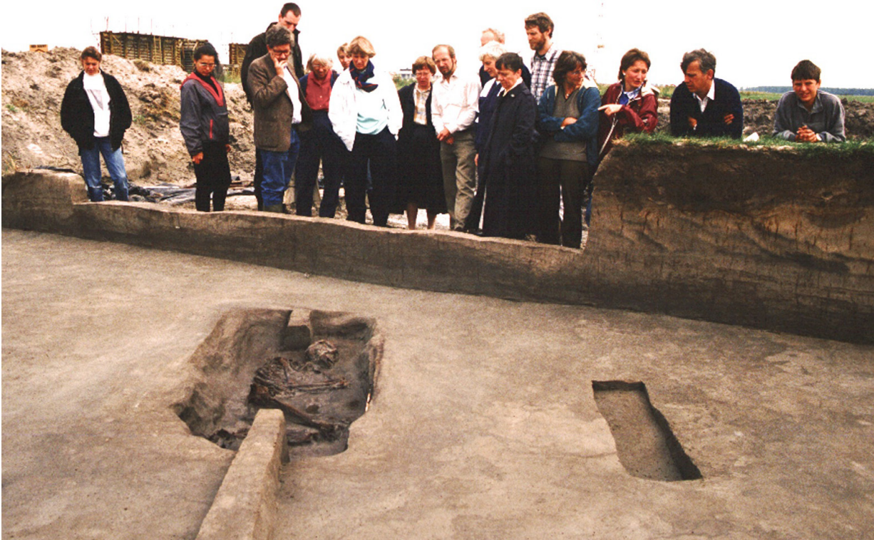
Belangstellenden bij grafheuvel, 1989, Velsbroek.

Bij de vaststelling van de regimes is getracht een verantwoorde balans te vinden tussen enerzijds de belangen van de archeologische monumentenzorg en anderzijds het maatschappelijk belang en de organisatorische uitvoerbaarheid.