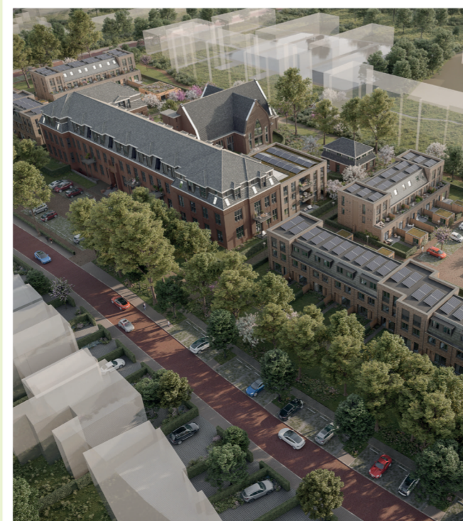
Equilis Nederland, architecten Van OmmerenAsselbergs

Op het terrein van het 100 jaar oude Missiehuis en de bijbehorende kapel is projectontwikkelaar Equilis in 2023 gestart met de bouw van 84 woningen en appartementen. Het project bestaat uit sociale huurwoningen, eengezinswoningen en grote herenhuisen, waarbij de bestaande gebouwen en groen blijven behouden. Verder zijn de woningen bijna energieneutraal en heeft gas plaatsgemaakt voor warmtepompen en zonnepanelen. Tussen de gebouwen wordt een groen park aangelegd met aandacht voor biodiversiteit.