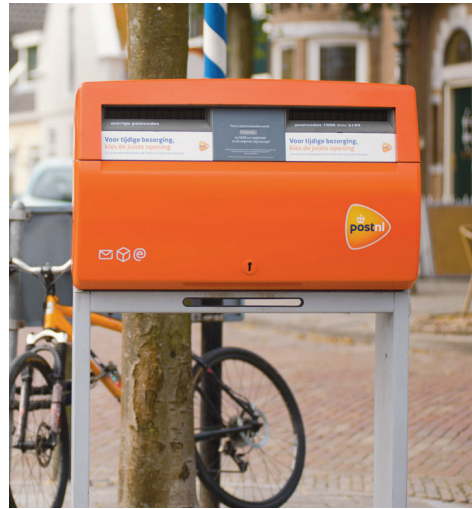
pakketautomaten en PostNL-punten bij jou in de buurt.

We versturen met z'n allen steeds minder post. PostNL leegt daardoor elke dag brievenbussen waar nauwelijks of geen post in zit. Daarom gaat PostNL vier brievenbussen verwijderen in Velsen. Vanaf 9 september verwijdert PostNL de brievenbussen in de volgende straten: Nicolaas Beetslaan in Driehuis, Zon Bastion in Velsersbroek, Hoofdstraat en J.T. Cremerlaan in Santpoort-Noord. In heel Noord-Holland haalt PostNL 192 van 1.192 brievenbussen weg. In Velsen staat nog steeds binnen een straal van 1 kilometer een brievenbus. Daarnaast komen er steeds meer automaten, waarin je pakketten én brieven kunt versturen. Op postnl.nl/locatiewijzer vind je alle brievenbussen, brief-