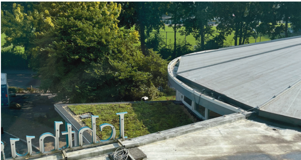
Foto: groen dak Ichthus Lyceum