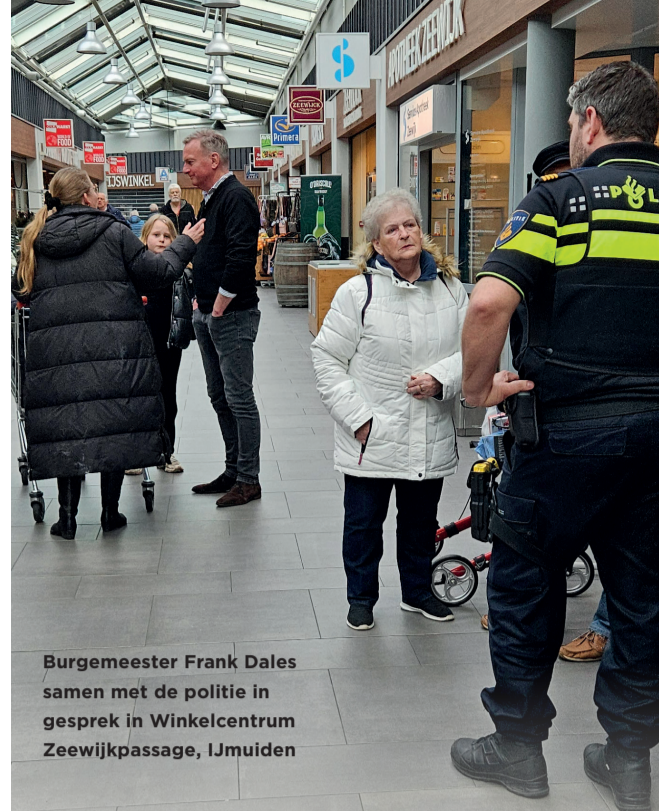
Burgemeester Frank Dales samen met de politie in gesprek in Winkelcentrum Zeewijkpassage, IJmuiden