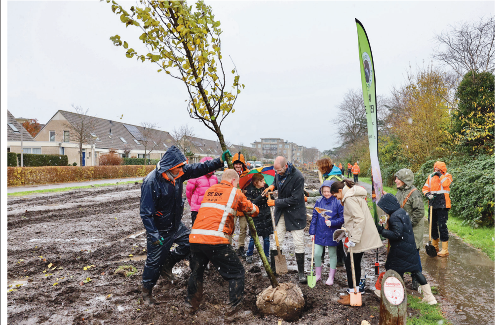
Onder winterse omstandigheden werden tientallen bomen geplant.

U kunt zich aanmelden voor de Buurtlabs door de QR code te scannen of door een mail te sturen naar samenspel@velsen.nl . Op www.samenspelvelsen.nl vindt u meer informatie over het project.