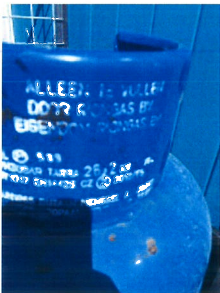
op 19 juli 2016