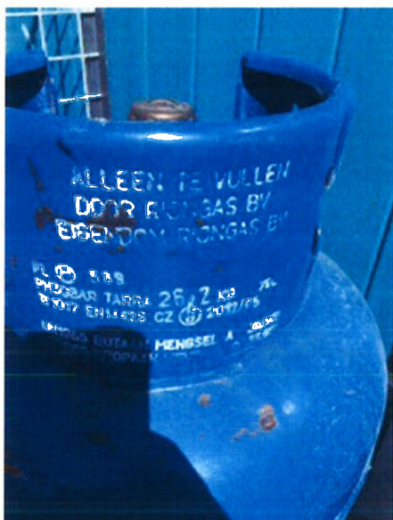
(Rianne van der Werf op 19 juli 2016 13:05)