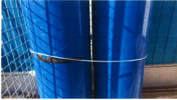
op 11 augustus 2016 09:26)