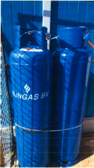
op 11 augustus 2016 09:26)