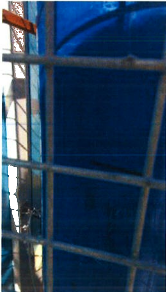
op 11 augustus 2016 09:26)