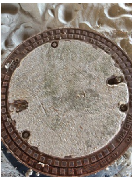
(Rianne van der Werf op 19 juli 2016 13:39)