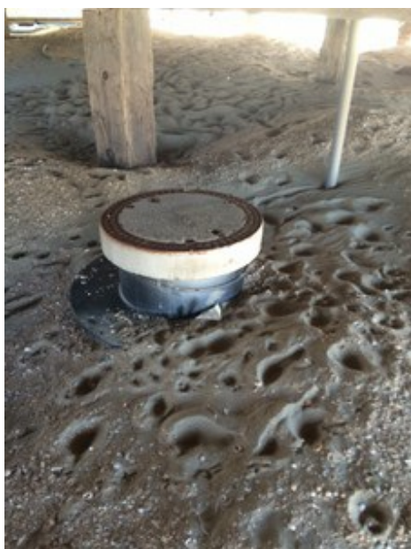
(Rianne van der Werf op 19 juli 2016 13:40)