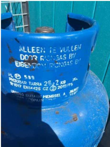
(Rianne van der Werf op 19 juli 2016 13:05)