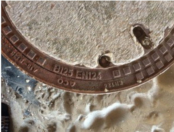
(Rianne van der Werf op 19 juli 2016 13:40)