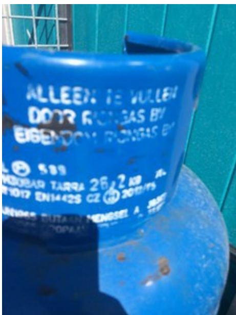
(Rianne van der Werf op 19 juli 2016