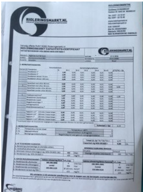
(Rianne van der Werf op 19 juli 2016 13:39)