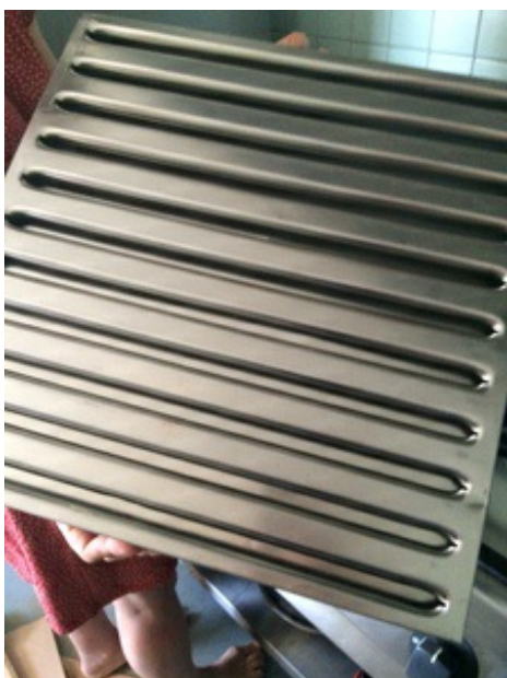
(Rianne van der Werf op 19 juli 2016 13:29)

Is de uitmondung van de afzuiginstallatie 2m boven de hoogste daklijn binnen een straal van 25m of is er een doelmatige ontgeuringsinstallatie? (Let op overgangsrecht!)