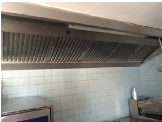
(Rianne van der Werf op 19 juli 2016 13:29)