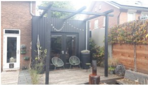
Foto 1, 2022-11-03_Hoogte_pergola_ingemeten.jpg J op 19 december 2022 15:16)

Foto 2, 2022-11-03_Foto_object_in_tuin_vijver.jpg J op 19 december 2022 15:16)