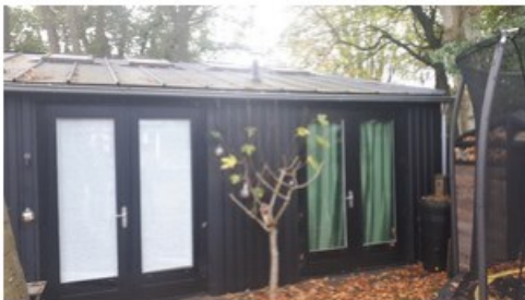
2022-11-03_Aanzicht.jpg J (op 19 december 2022 15:15)