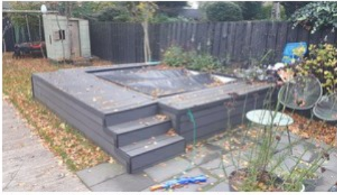
Foto 2, 2022-11-03_Foto_object_in_tuin_vijver.jpg J op 19 december 2022 15:16)

2022-11-03_Detail_object_met_buurperceel_nr._21.jpg J op 19 december 2022 15:15)