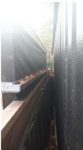
2022-11-03_Detail_object_met_buurperceel_nr._17.jpg J (op 19 december 2022 15:15)