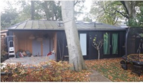
Foto 3, 2022-11-03_Vergunningvrije_object_met_rechts_B_B.jpg [REDACTED] op 19 december 2022 15:17)

Wie is of zijn de vermeende overtreder(s)?